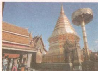
Cykelturen går förbi Wat Pho. Här inne ligger den vilande Buddhan.

På små plastallikar serveras rykande heta nudlar med fläsk och grönsaker och