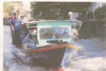
Båt i klongerna. Lika vanlig kollektivtrafik som bussen. Hjälmar på konduktörerna skyddar mot de låga broarna.

muggar fylls med iste. Notan går på några kronor.