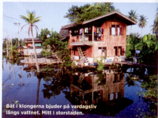
Båt i klongerna bjuder på vardagsliv längs vattnet. Mitt i storstaden.